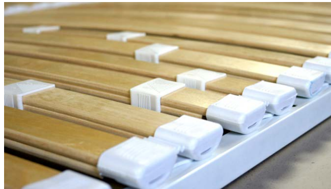
■ латодержатели на металлической раме