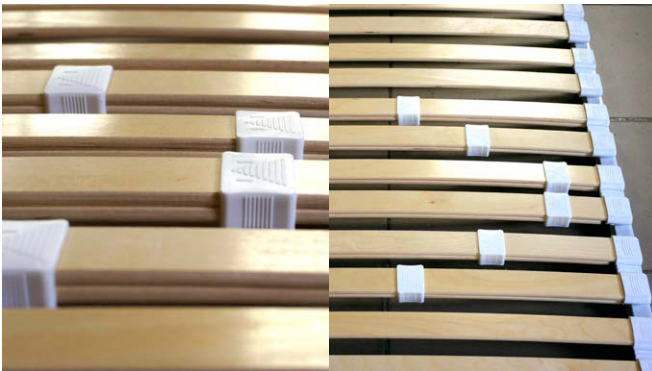
■ регулировочные слайдеры

Настройка жесткости поясничной секции основания осуществляется благодаря двойным регулируемым латам, и специальным скользящим регуляторам - слайдерам. Максимальная жесткость достигается, когда слайдеры сдвинуты в стороны – по краям латофлексов, и наоборот – чем ближе к центру расположены слайдеры, тем меньше жесткость.