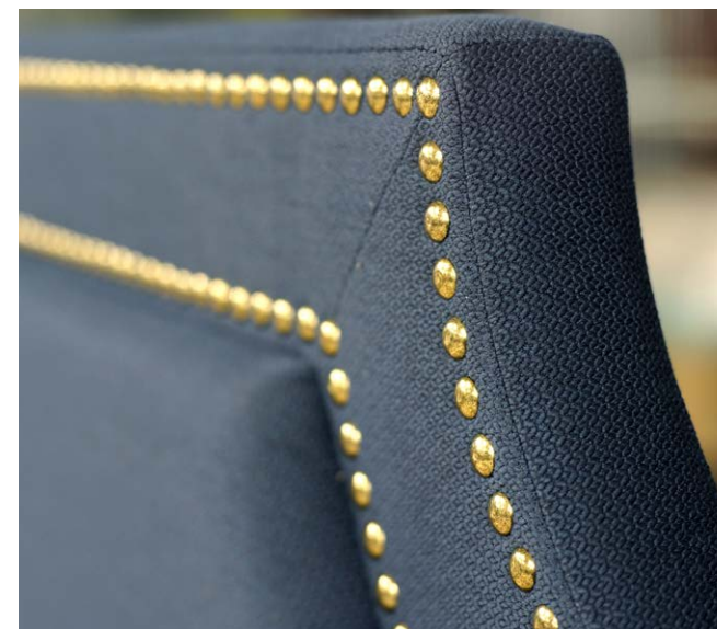
■ декоративные гвозди на изголовье кровати